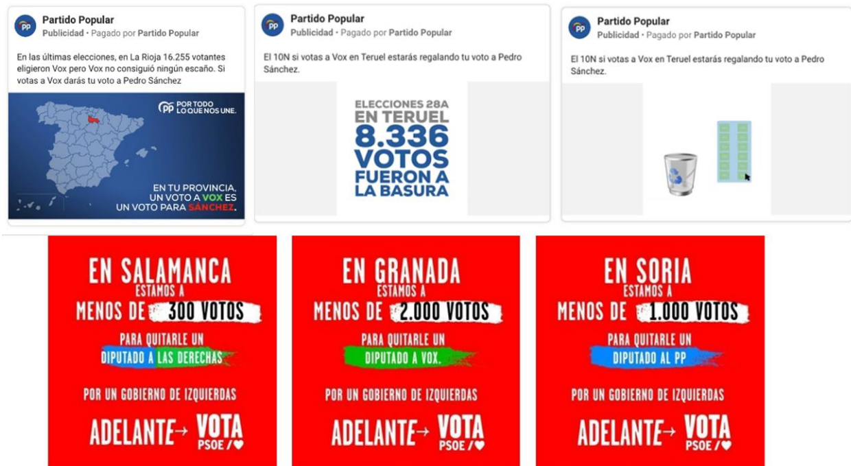
Figura 6. Anuncios del PP en la campaña del 10N (2019) y del PSOE en la campaña del 23J (2023)