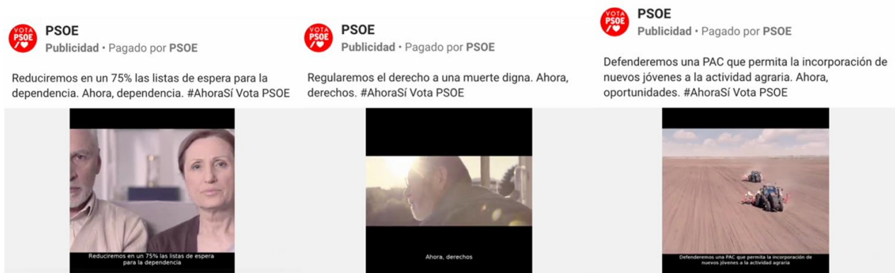
Figura 3. Anuncios del PSOE en Facebook correspondientes a la campaña del 10N (2019)