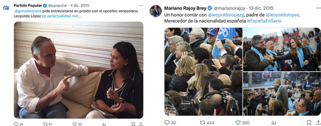
Figura 14. Tweets del PP y Mariano Rajoy sobre Venezuela (2015)