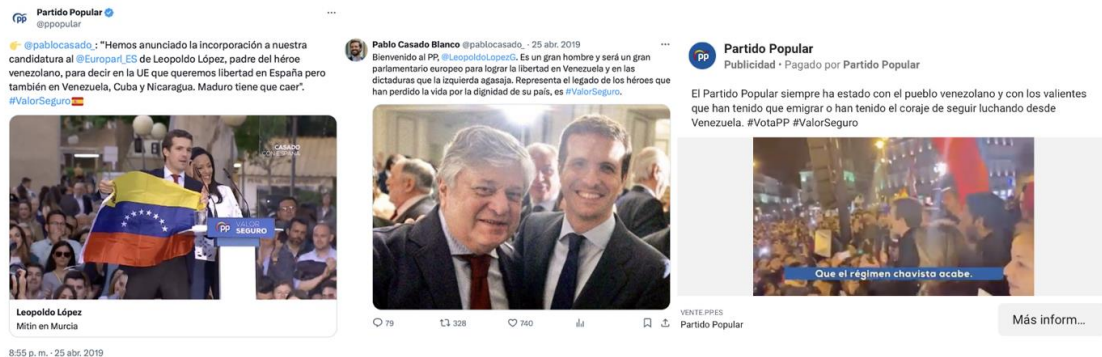
Figura 17. Imágenes de Pablo Casado en apoyo a Venezuela (2019)