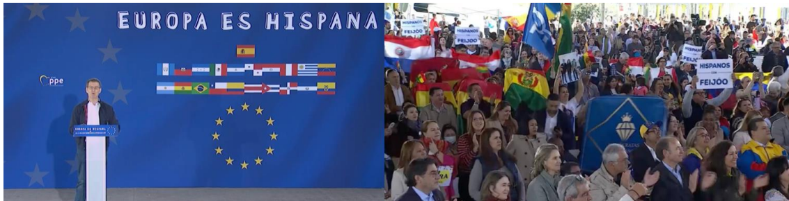
Figura 18. Imágenes de Alberto Núñez Feijóo en “Europa es Hispana” (2023)

Fuente. Captura de video disponible en el Twitter del PP: https://x.com/i/broadcasts/1YqKDoLrpgaxV?s=20