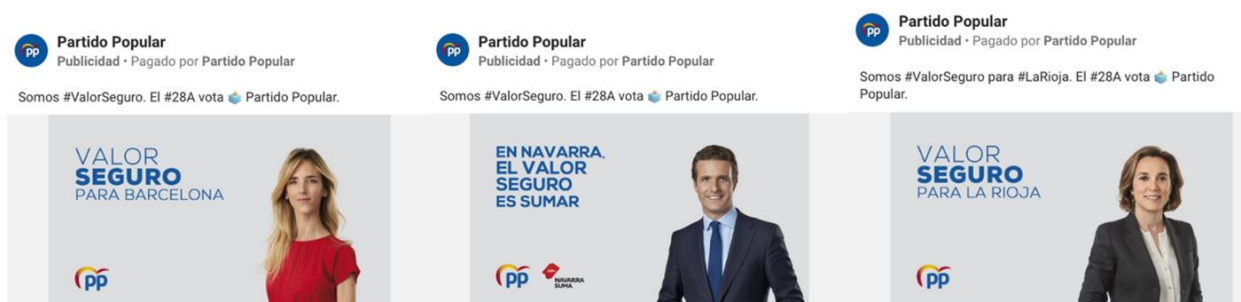
Figura 4. Anuncios de diputados del PP en Facebook correspondientes a la campaña del 28A (2019)