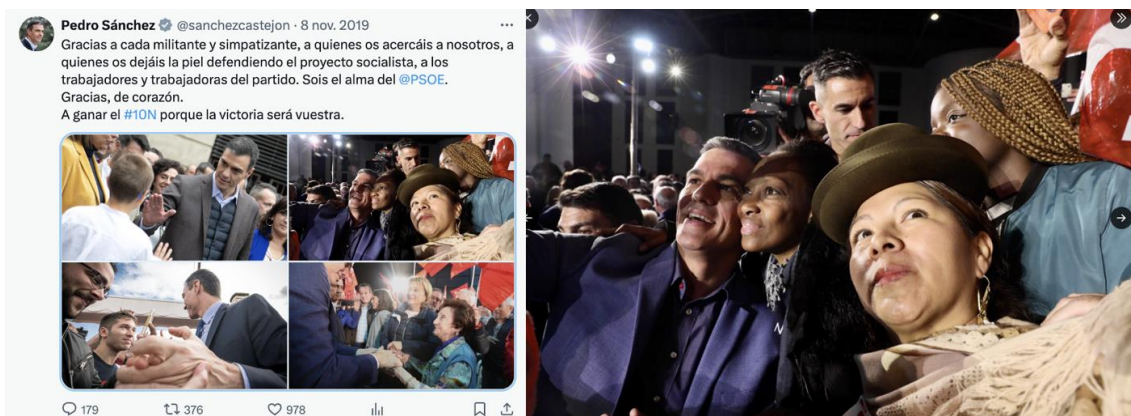
Figura 12. Tweet de agradecimiento de Pedro Sánchez (2019)

Fuente. Captura del Twitter de Pedro Sánchez (2019), disponible en: https://x.com/sanchezcastejon/status/1192934173843107840