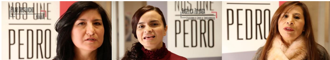
Figura 7. Video de la plataforma de apoyo a Pedro Sánchez "Nos une Pedro" (2015)