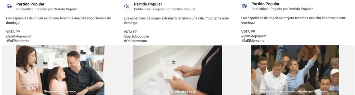
Figura 21. Segundo anuncio del PP apelando al voto latino (2023)

Fuente. Capturas de spot “Sé que no me equivoco” disponible en el Facebook Ads del PP, disponible en: https://www.facebook.com/ads/library/?id=1611146119368945 https://x.com/ppopular/status/1680113078103339012