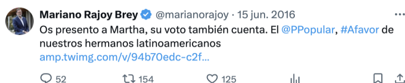
Figura 16. Tweet de Mariano Rajoy apelando al voto latino (2016)