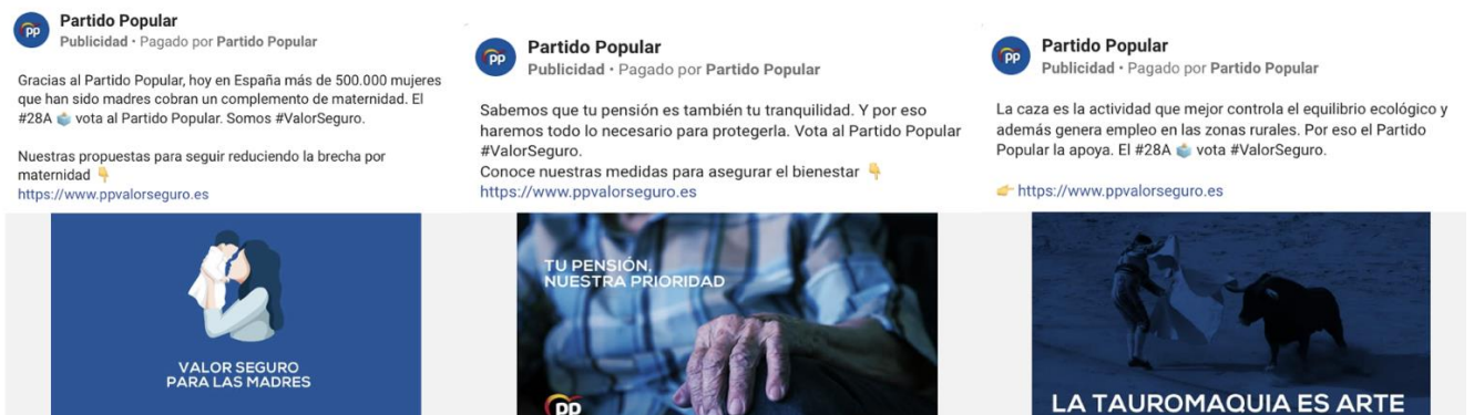
Figura 2. Anuncios del PP en Facebook correspondientes a la campaña del 28A (2019)