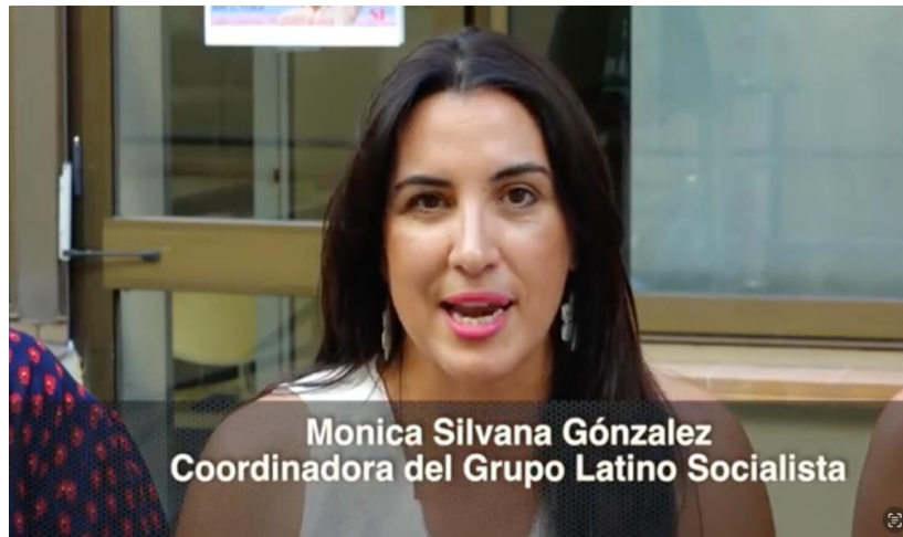
Figura 8. Vídeo del PSOE en 2016: “Un sí por la diversidad”