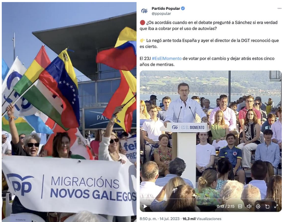
Figura 19. Imágenes de Colectivo “Novos Galegos” en Galicia y mitin en Santander (2023)