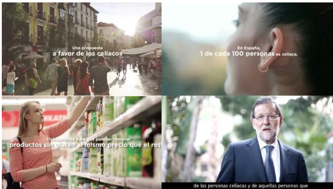
Figura 1. Anuncio del PP dirigido a personas celíacas