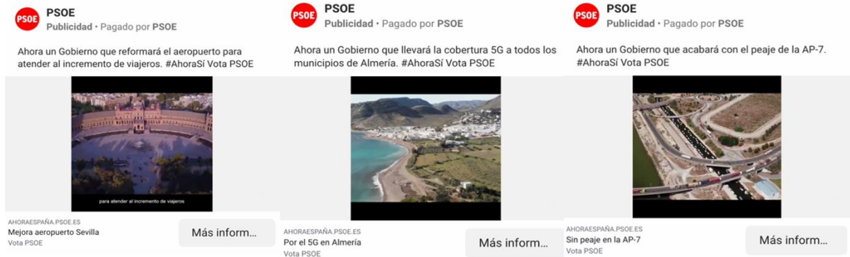
Figura 5. Anuncios del PSOE en Google Ads correspondientes a la campaña del 10N (2019)