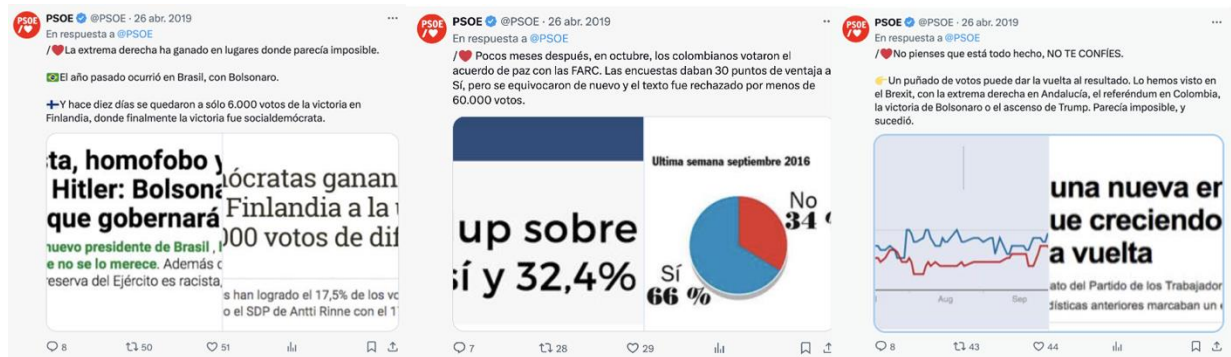
Figura 9. Menciones del PSOE sobre América Latina (2019)