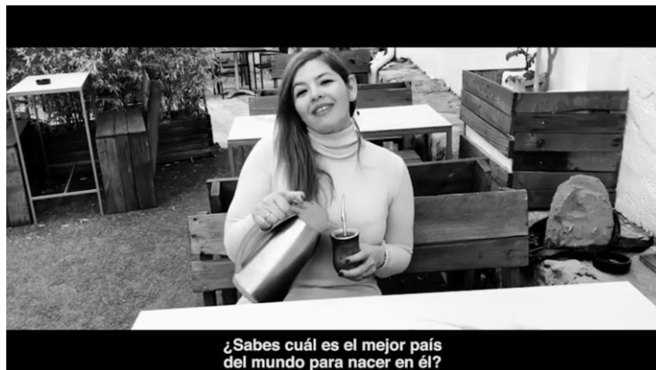
Figura 11. Anuncio del PSOE “¿Sabes cuál es el mejor país del mundo?” (2019)