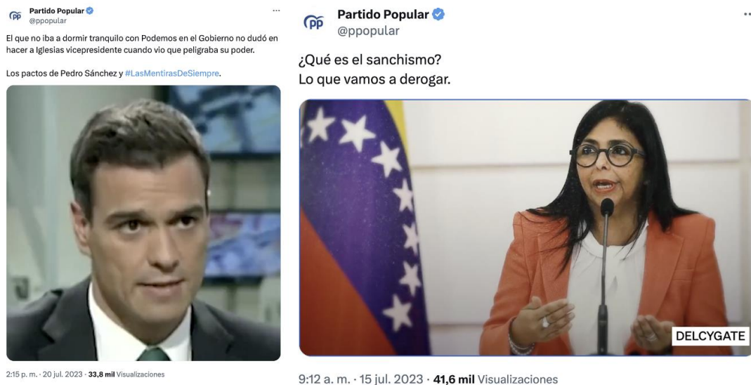
Figura 20. Anuncios del PP contra las palabras de Pedro Sánchez y su vínculo con Venezuela (2023)

Fuente. Capturas de video disponible en el Twitter del PP: https://x.com/ppopular/status/1682001156212506624 y https://x.com/ppopular/status/1680113078103339012