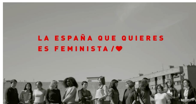
Figura 10. Anuncio del PSOE para para el voto feminista (2019)