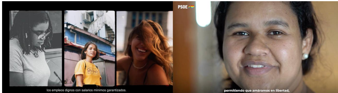
Figura 13. Inclusión de perfiles diversidad cultural en spots del PSOE (2023).

Fuente. Captura de spots del PSOE (2023) disponibles en: https://www.youtube.com/psoe