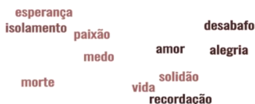
Figura 2. Word Cloud com principais palavras presentes nos copies associados aos posts dos jornalistas analisados

A figura 2 apresenta uma “nuvem de palavras” com as principais destacadas nos copies associados às publicações dos jornalistas.