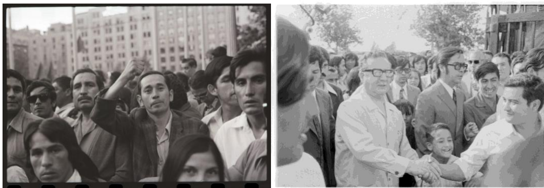
Figura 2: Manifestación de apoyo en La Moneda al Presidente Allende de regreso de la ONU, 1972. / El Presidente de la República, Salvador Allende Gossens en Sumar S.A. Febrero de 1973.