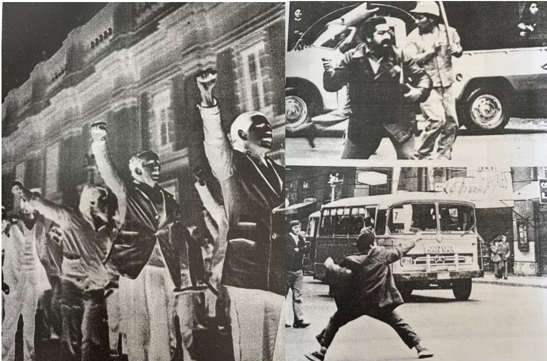
Figura 3: Primeras manifestaciones cívicas contra el régimen impuesto por la Junta Militar. Septiembre de 1973.