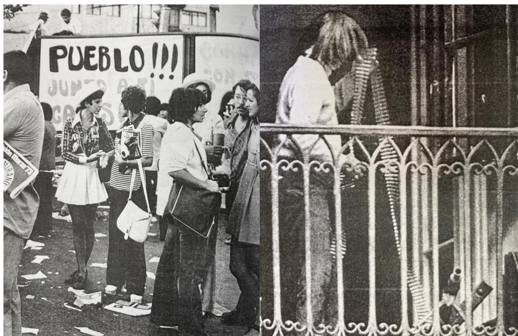
Figura 4: Dos formas de resistencia la calle y las armas Septiembre de 1973.