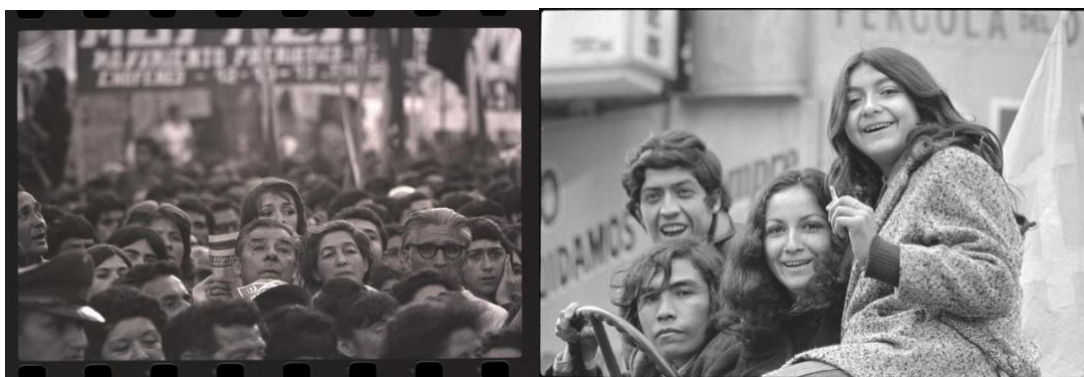
Figura 1: Celebración comicios 04 de noviembre 1972. / Palacio de La Moneda, celebración del Primero de Mayo (día del trabajo) organizado por la CUT (Central Unitaria de Trabajadores), encabezada por el Presidente de la República Salvador Allende Gossens en 1973.