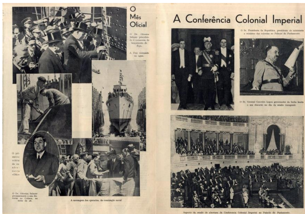
Fig. 3: Duas das 4 pág. do destacável do nº1 do DL mensal , predominantemente dedicado a registar fotograficamente as principais ações oficiais do governo e do ditador Oliveira Salazar.