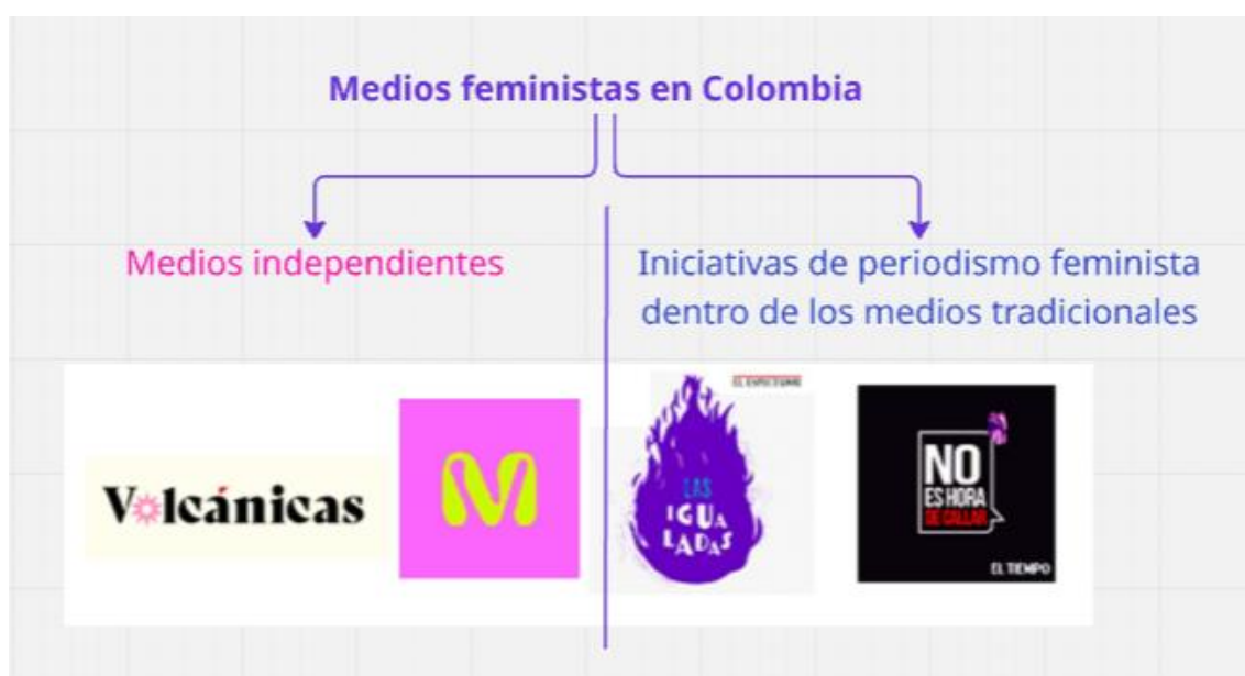
Figura 2: Iniciativas de periodismo feminista en Colombia

Por otra parte, están las iniciativas dentro de grandes casas editoriales: Las Igualadas que forma parte de El Espectador, y No es Hora de Callar que está vinculada a la Casa Editorial El Tiempo. Aunque ambas iniciativas promueven agendas feministas, estas cuentan con mayor alcance de difusión, otorgándoles mayor visibilidad mediática pero también ciertas limitaciones editoriales (Ver figura 2)